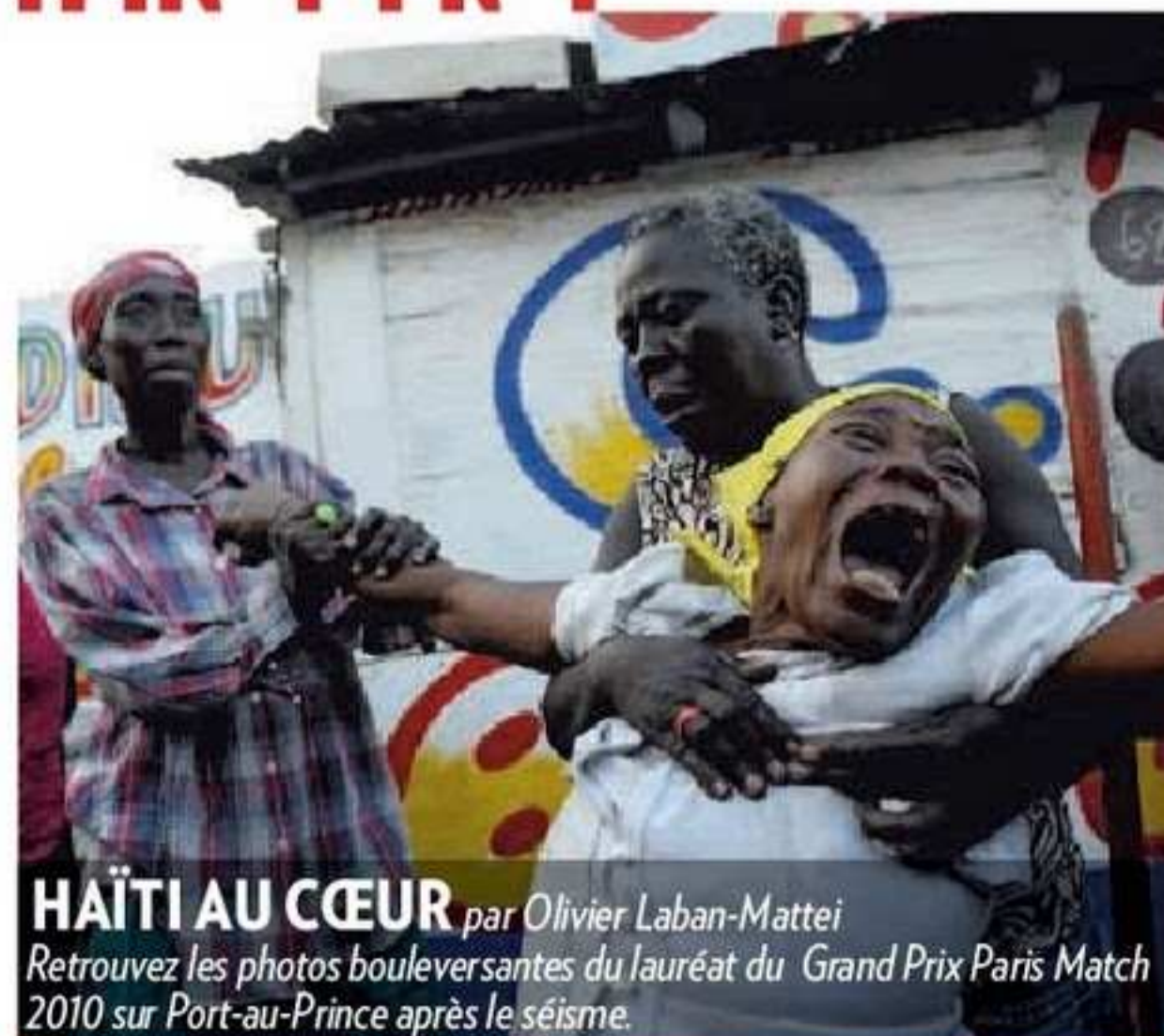
HAÏTI AU CŒUR par Olivier Laban-Mattei Retrouvez les photos bouleversantes du lauréat du Grand Prix Paris Match 2010 sur Port-au-Prince après le séisme.

Retrouvez sur parismatch.com l'émission "MATCH +", avec les témoins de l'actualité.